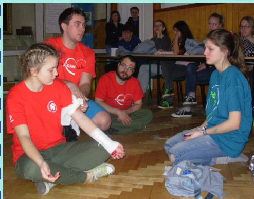
Szkolenie z pierwszej pomocy przedmedycznej