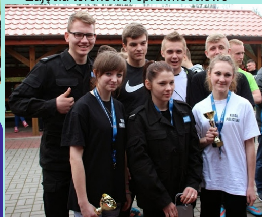
Mistrzyni Województwa Mazowieckiego 2015 w zawodach „Sprawni jak żołnierze”