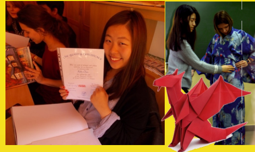
Nasi goście z Japonii, Indonezji, Indii, Tajwanu.