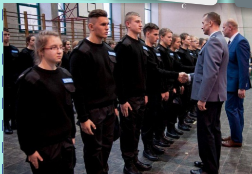
Uroczystość Ślubowania i Promocji