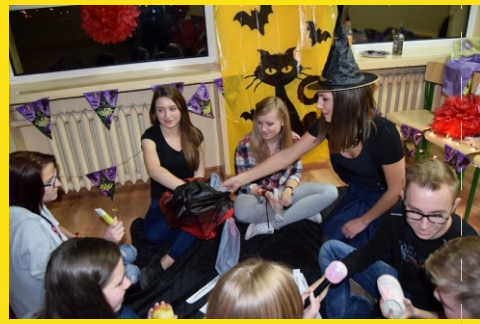
Zajęcia z lektorami studia językowego American Center