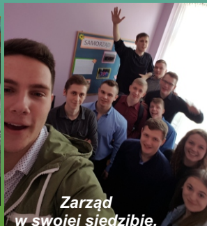
Zarząd w swojej siedzibie.