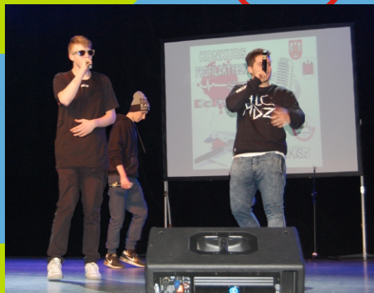
„Elo Squad” Grand Prix w konkursie „Stop dopalaczom”