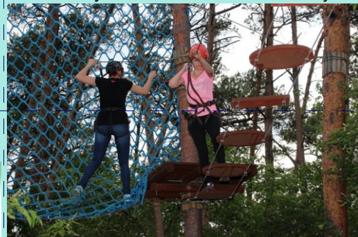
Zajęcia terenowe, sprawnościowe