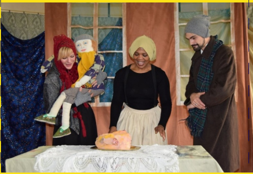
„Opowieść wigilijna” w wykonaniu The Bear Educational Theatre.